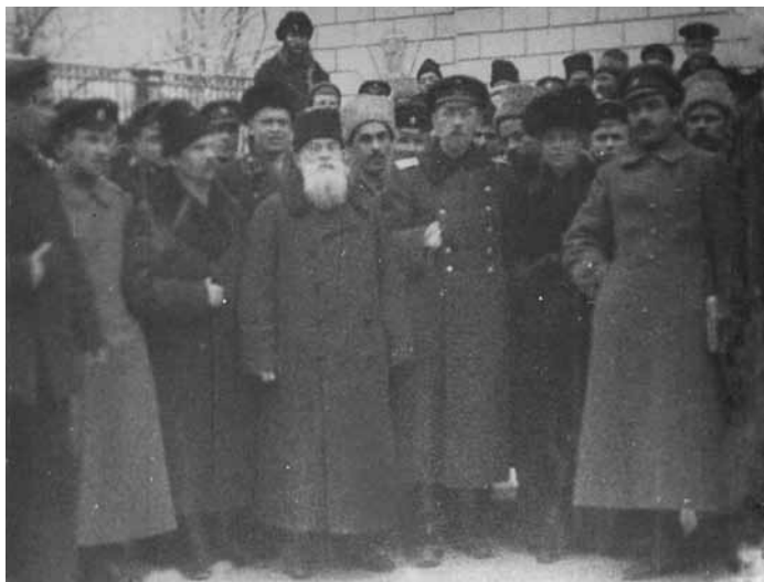
Лл. 9. Михайло Грушевський з членами Центральної Ради та українськими вояками під час 8-ї сесії УЦР. Київ. Софійський майдан. Грудень 1917 р.