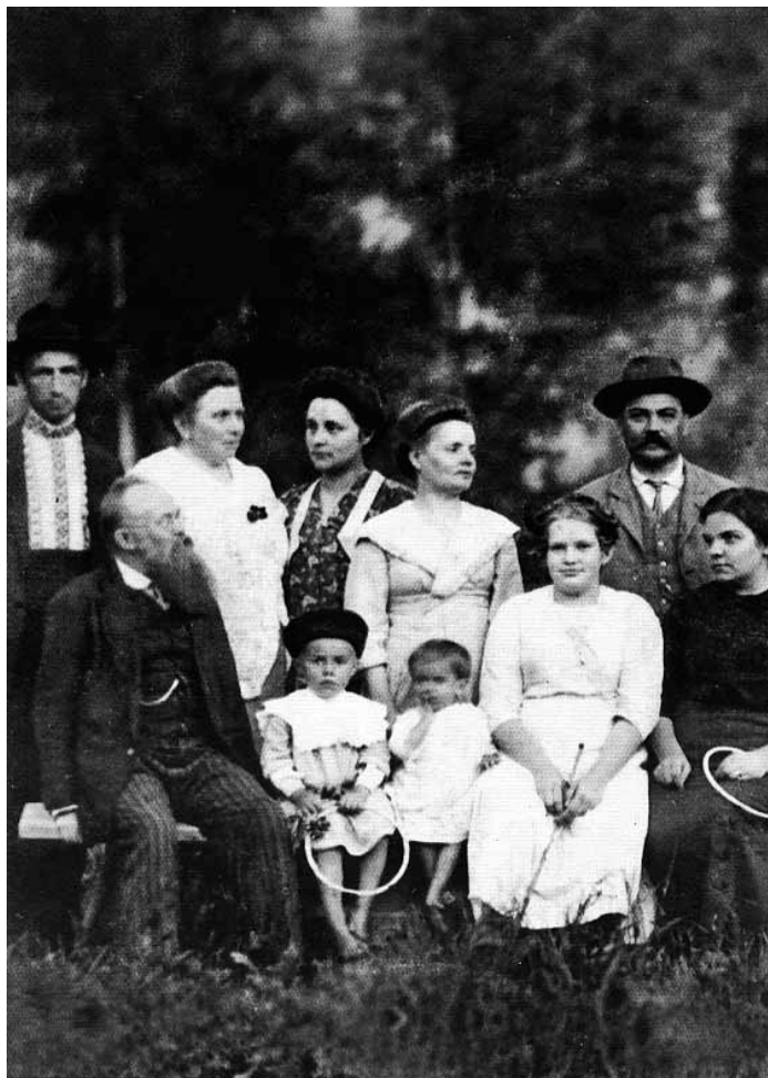
Л. 2. Михайло Грушевський (сидить перший ліворуч) з родиною на власному «хутірці» в селі Криворівня на Гуцульщині. 16 серпня 1912 р.