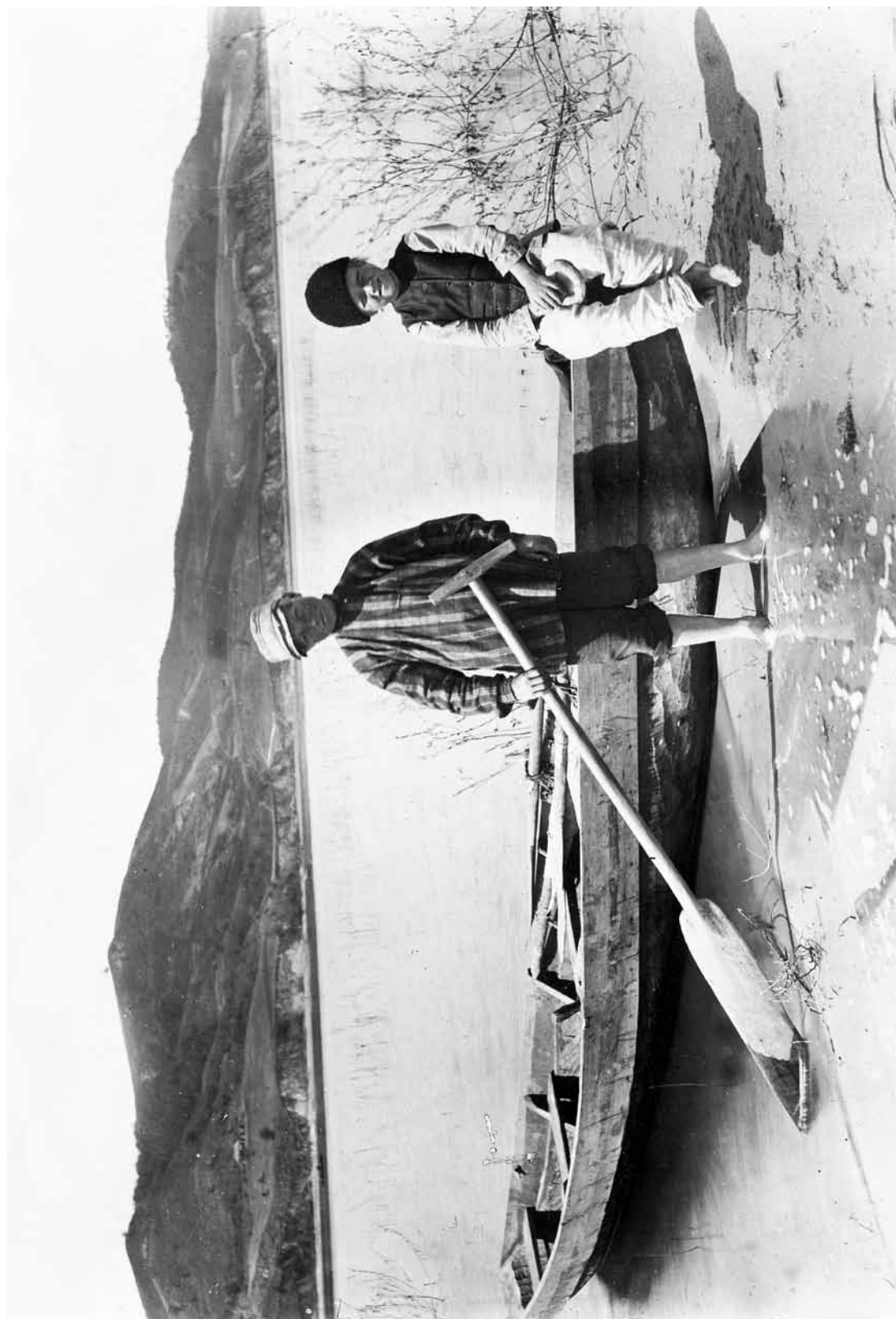
47. ХЛОПЦІ НА ПРИСТАНІ. С. ПРОХОРІВКА НА КАНІВЦІНІ. 1892. 47. BOYS IN A BOAT LANDING PLACE. PROKHORIVKA VILLAGE, KANIV DISTRICT. 1892.