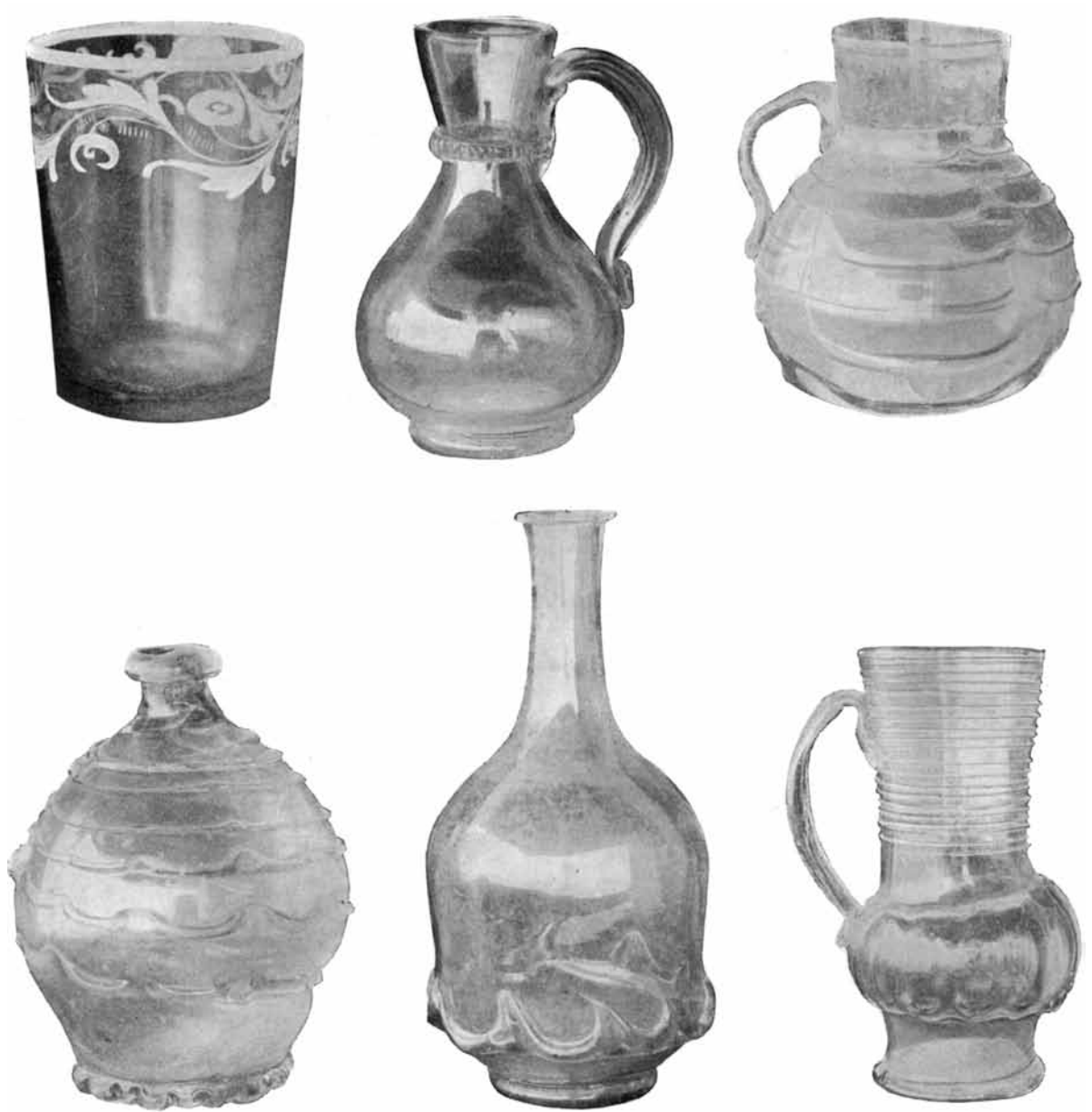
71-76. GLASS JUGS, BOTTLES, AND TUMBLER 71-76. СКЛЯНІ ГЛЕЧИКИ, ПЛЯШКИ ТА СКЛЯНКА