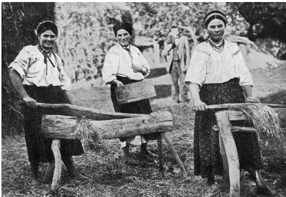
2. PREPARING THE HEMP IN KIEFF, SOUTH UKRAINE 2. ТІПАННЯ КОНОПЕЛЬ. КИЇВЩИНА