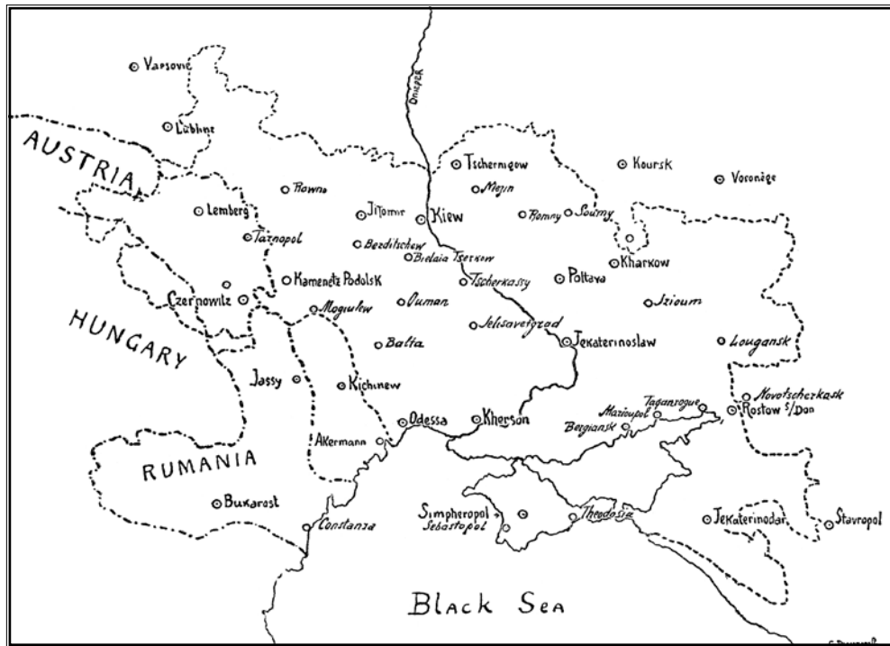
UKRAINE | УКРАЇНА

coincided with that period, and the revival of other museums (those of Poltava, Tchernihov, Zhitomir, Kamenetz, Kherson) greatly helped the work of the pioneers. At the present time there are already large collections in existence. Still, they are not yet sufficiently comprehensive to give any clear and full idea of the Ukrainian peasant art in all its branches; this goal is not yet even in view. Every fresh excursion into the country produces something so strikingly new that it often opens up new fields of applied art; sometimes it seems as if the stock of articles in possession of the peasants was inexhaustible.