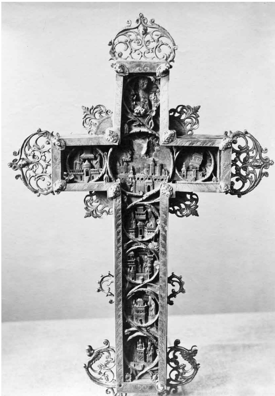
71. НАПРЕСТОЛЬНИЙ ХРЕСТ. СВІТЛИНА ПОЧ. XX СТ. 71. ALTAR CROSS. AN EARLY 20th CENTURY PHOTOGRAPH