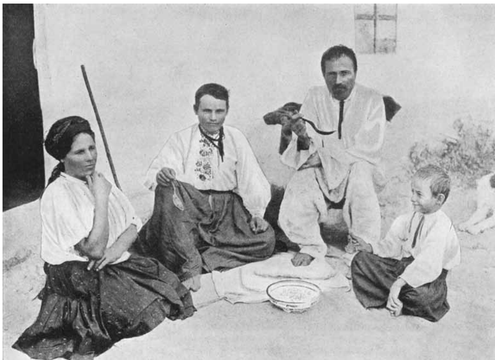
1. PEASANT FAMILY FROM KIEFF, SOUTH UKRAINE 1. СЕЛЯНСЬКА РОДИНА З КИЇВЩИНИ