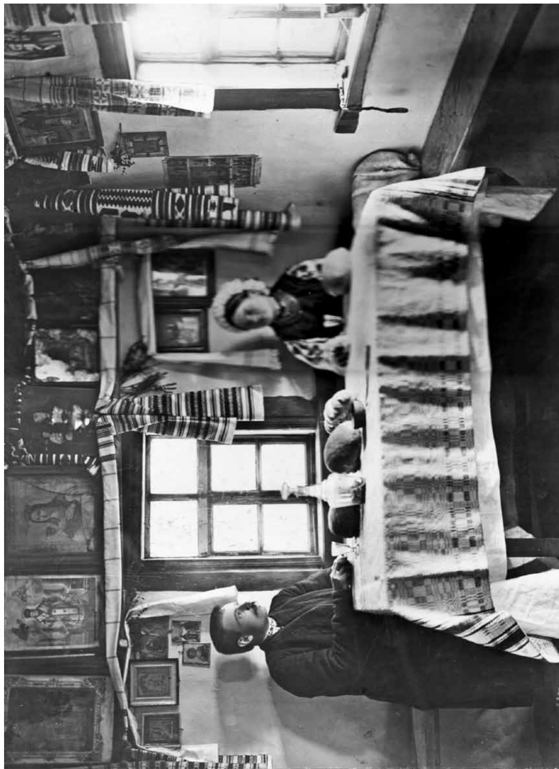
30. ПОДРУЖЖЯ ЗА СТОЛОМ. КИЇВЩИНА. ПОЧ. ХХ СТ. 30. COUPLE AT A TABLE. KYIV REGION. EARLY 20th CENTURY.