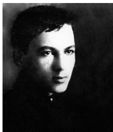
Лесь Лозовський Фото 1916 року