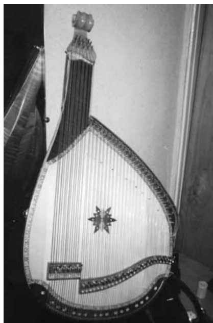
Іл. 15. Хроматична харківська бандура конструкції В. Герасименка (№ 2)