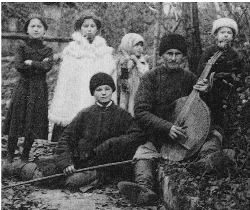
Іл. 43. Чернігівський кобзар Терентій Пархоменко (1904 р.)