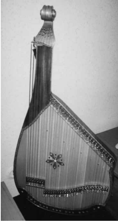
Іл. 16. Хроматична харківська бандура конструкції В. Герасименка (№ 3)