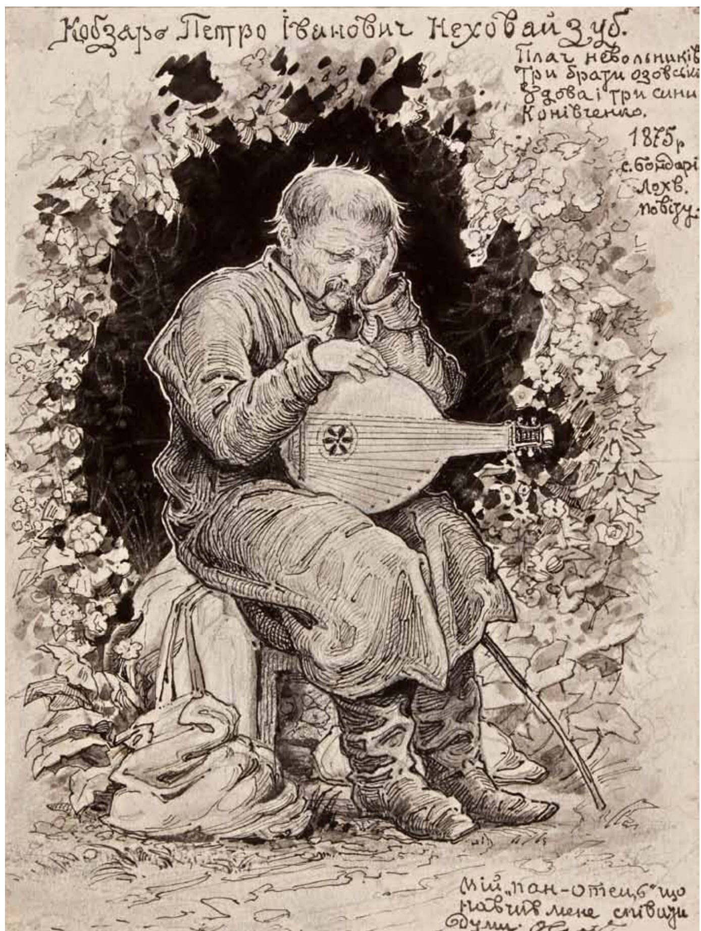
Портрет кобзаря Петра Неховайзуба (1875 р.)