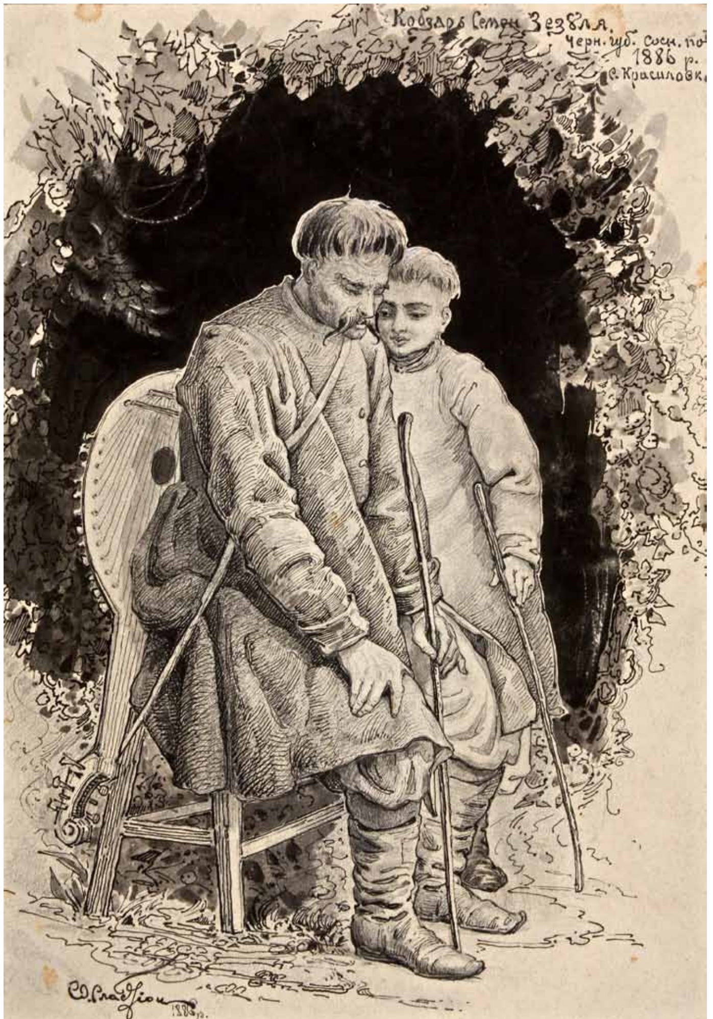
Портрет кобзаря Семена Зезулі (1886 р.)