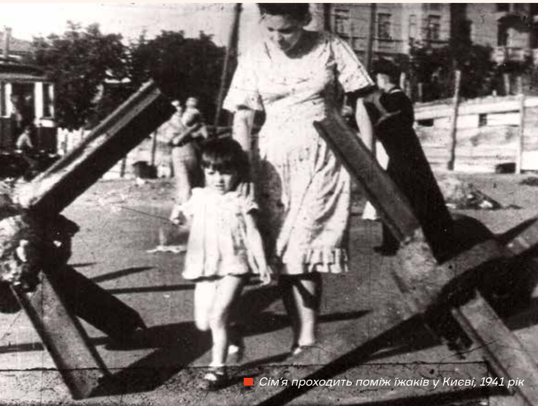
■ Сім'я проходить поміж іжаків у Києві, 1941 рік

Я жила в Києві у березні та квітні 2022 року, і все було на вигляд майже таке саме.